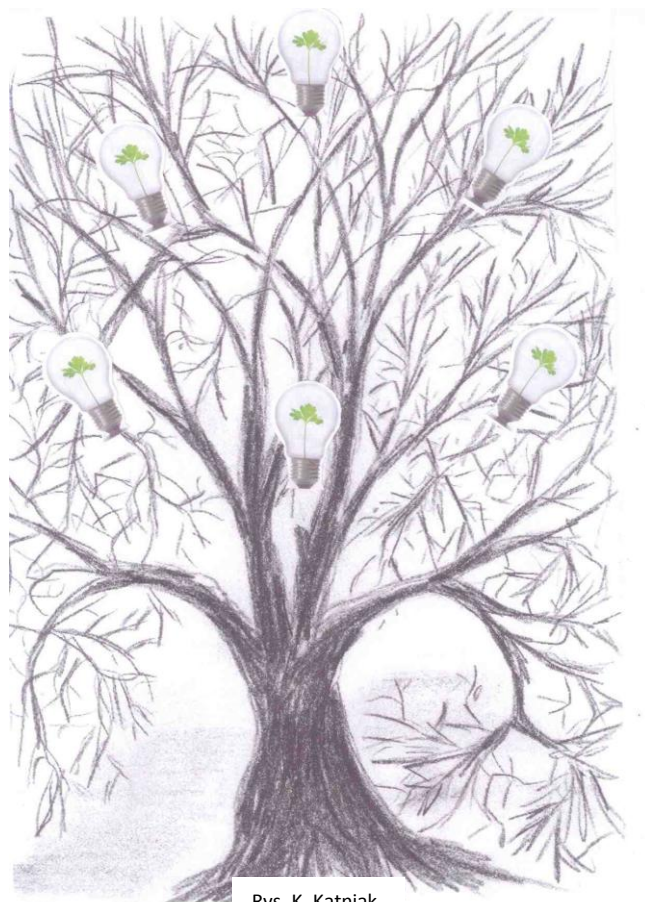
Rys. K. Kątniak

Porozmawiajcie z lokalnymi organizacjami pozarządowymi, poszukajcie partnerów. Ten początkowy etap kształtowania świadomości mieszkańców może trwać kilka miesięcy, a nawet rok. Jest bardzo ważne, aby maksymalnie dużo osób w waszej miejscowości rozumiało wyzwania związane z obecną sytuacją na świecie, zmianami klimatu i modelem rozwoju nastawionym na ciągły wzrost oraz by rozumieli kierunek potrzebnych zmian.